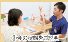
③ 今の状態をご説明